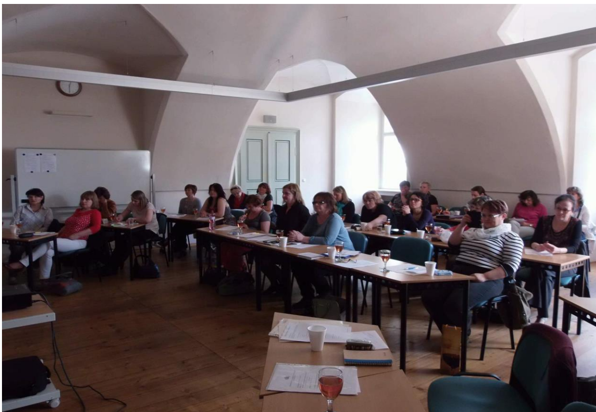
SKIPování 2015, zdroj Rajče SKIP 02